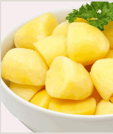
Salzkartoffeln ohne Petersilie